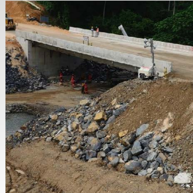
Puente Carretera Miches