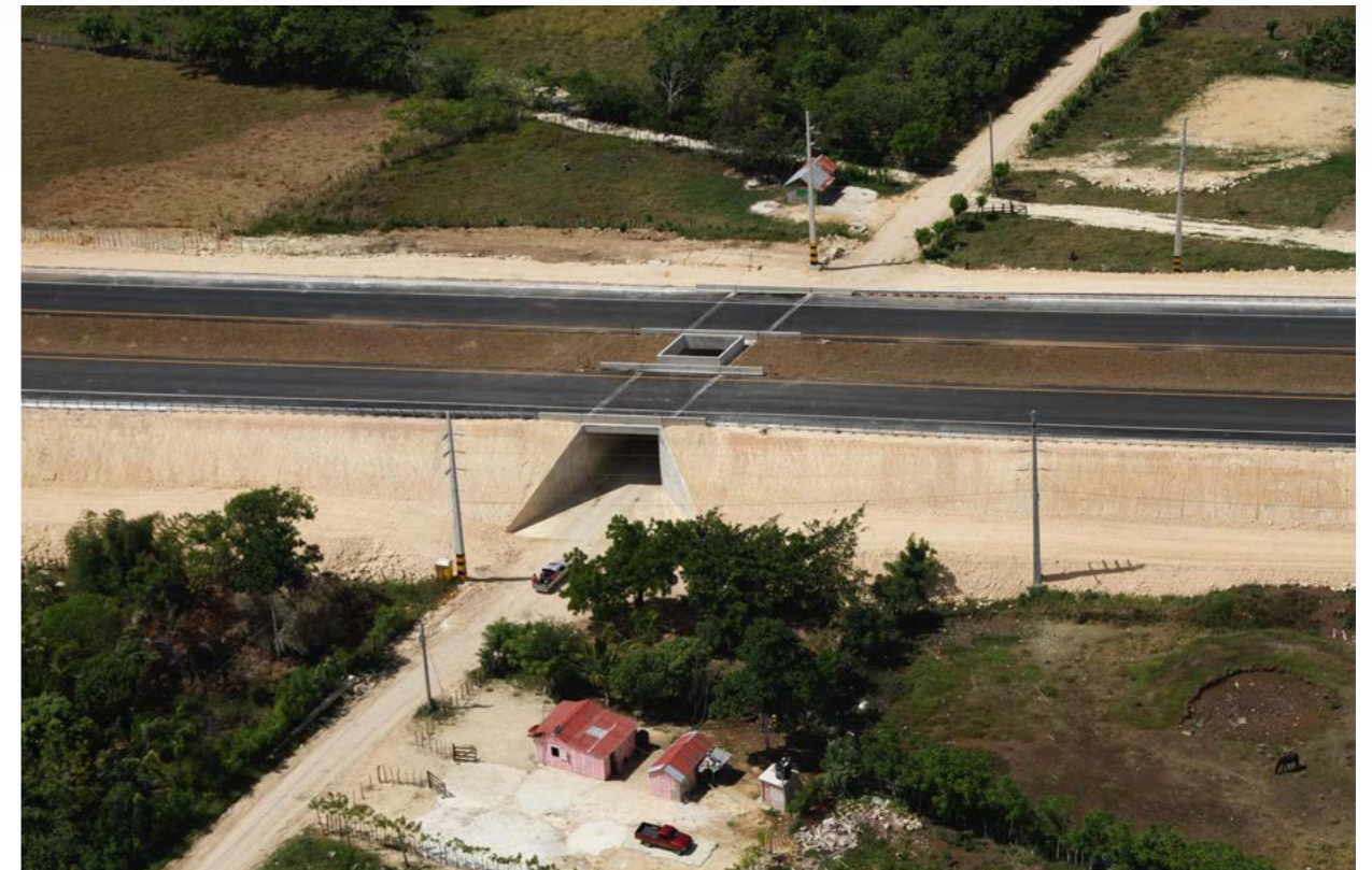
Alcantarilla Tipo Cajon Autopista del Coral