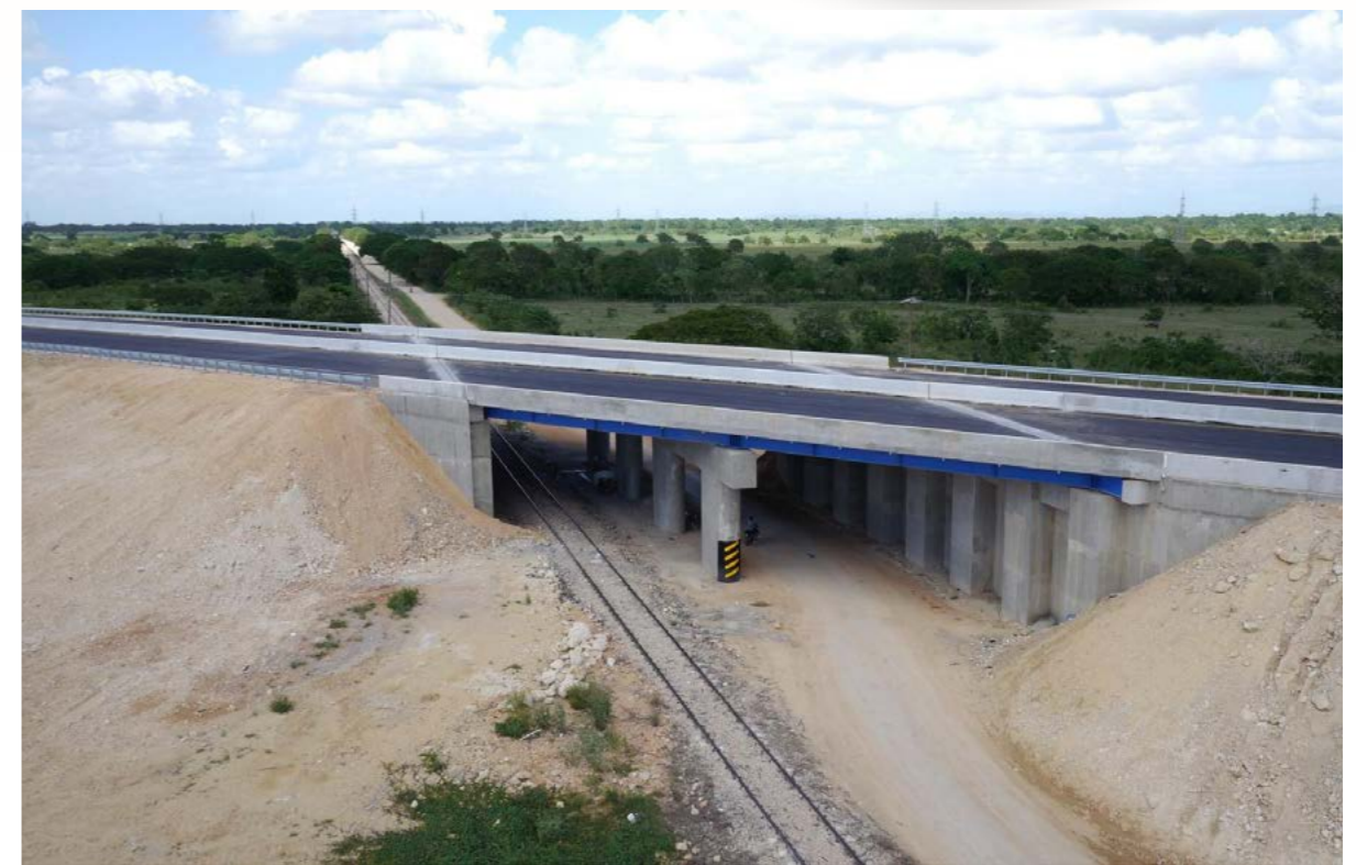
Puente sobre cruce Guimate-Autopista Coral