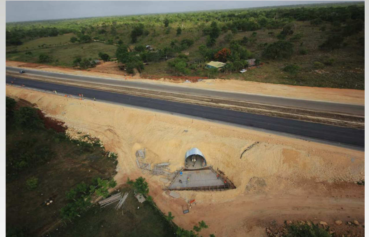
Alcantarilla Tipo Riblock Autopista del Coral