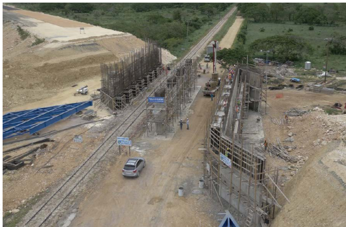
Puente sobre cruce Guimate-Autopista Coral