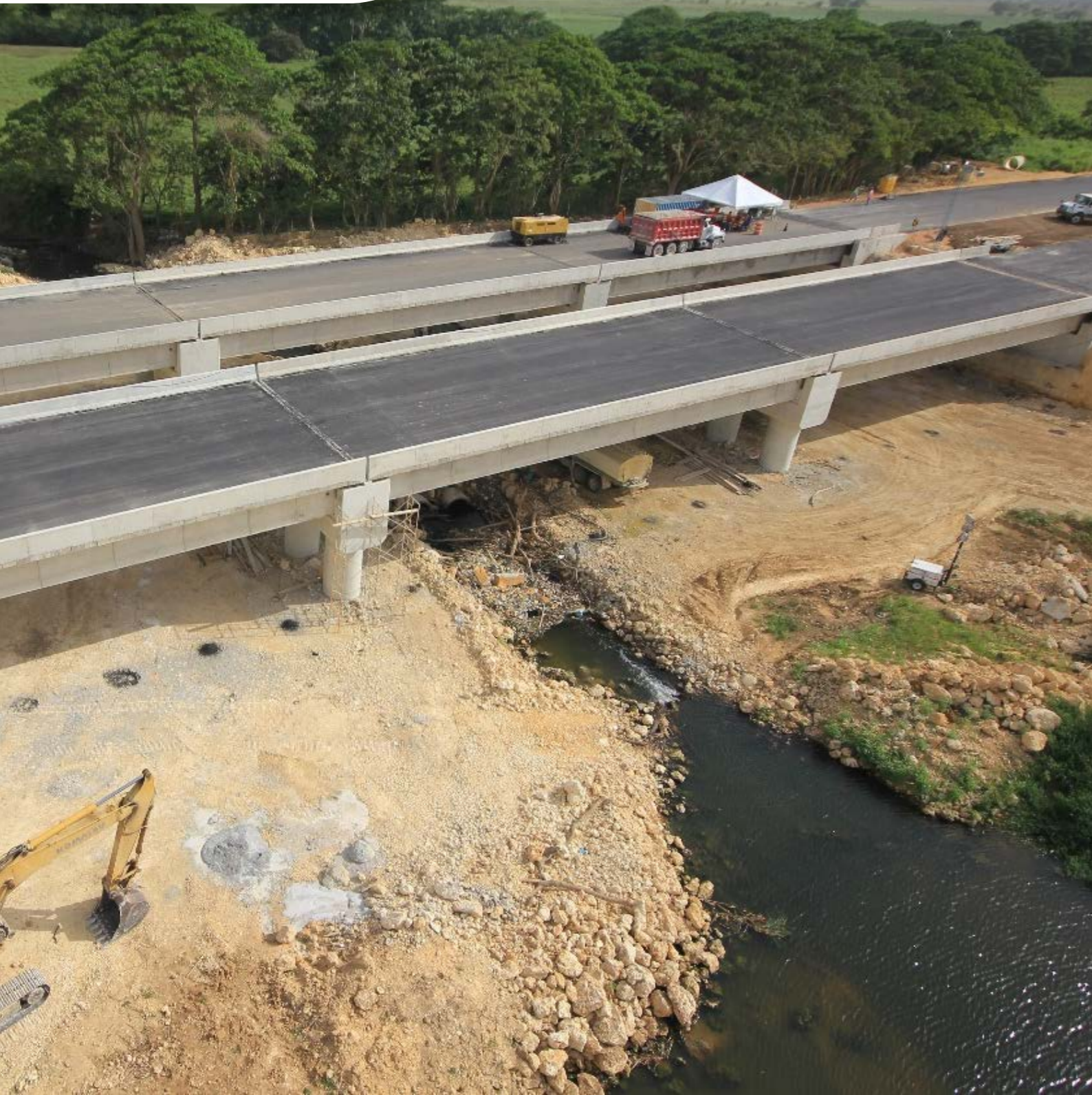
Puente Autopista del Coral