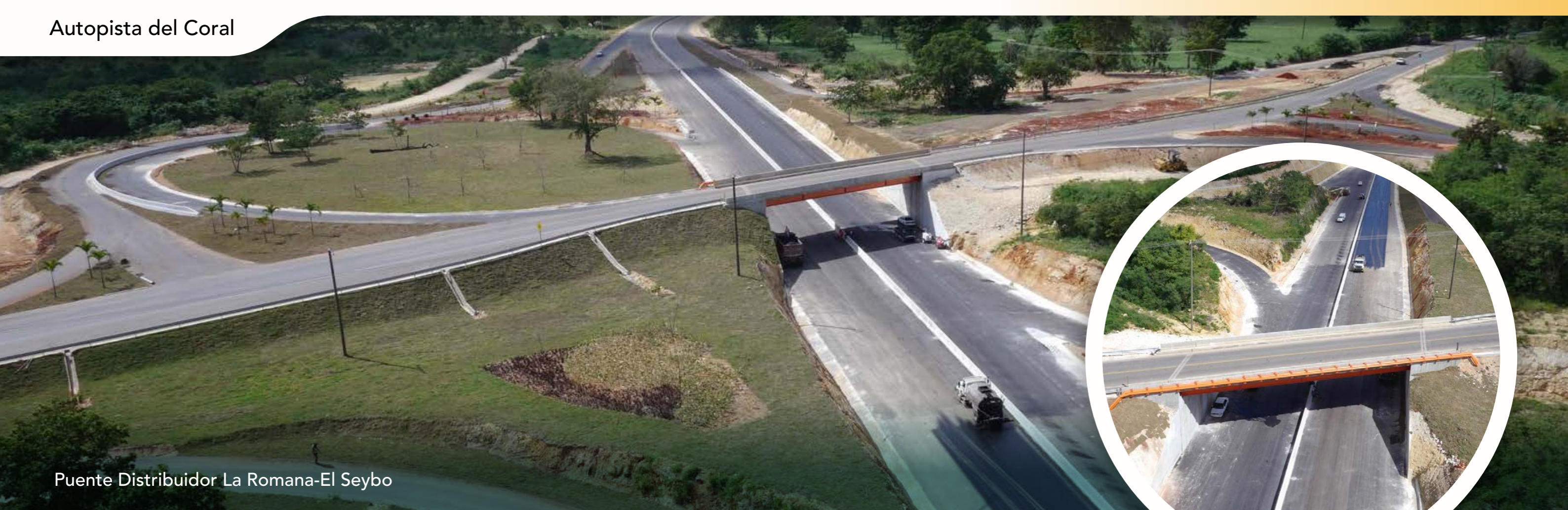
Puente Distribuidor La Romana-El Seybo