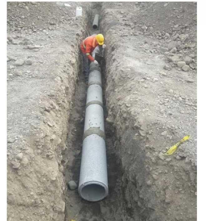
Contruccion Drenaje Pluvial y Mejoramiento Cañada