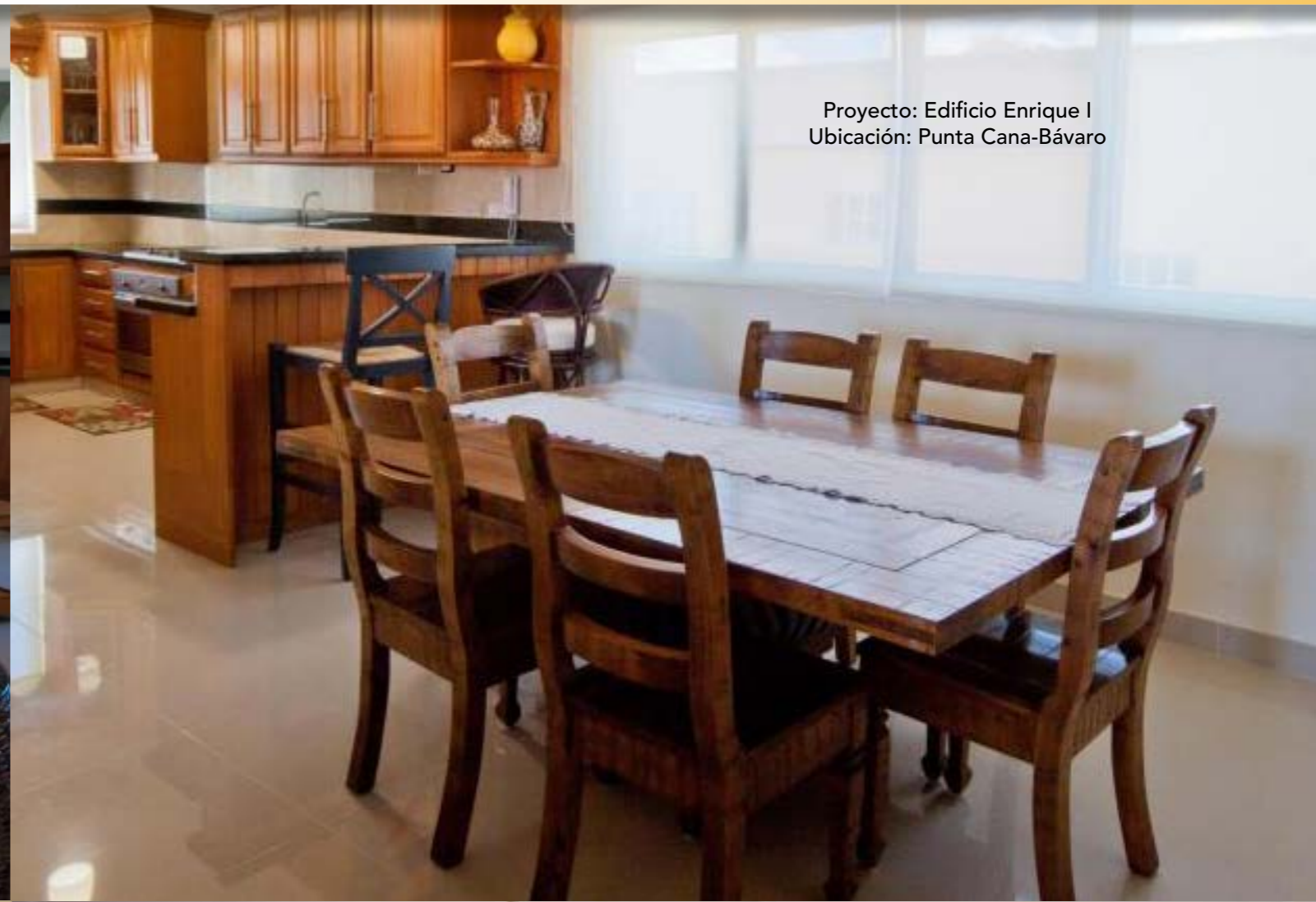
Proyecto: Edificio Enrique I Ubicación: Punta Cana-Bávaro