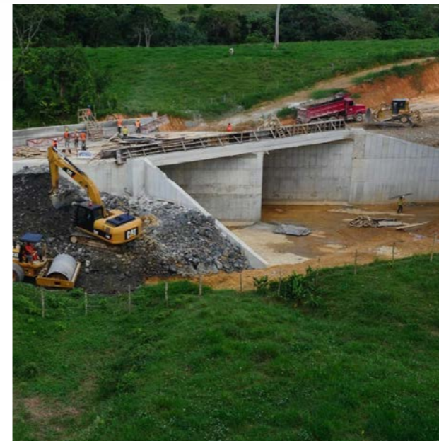
Puente Carretera Miches