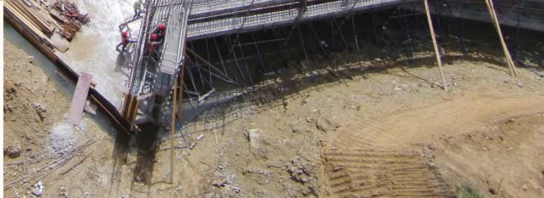
Puente Carretera Piedra Blanca-Rancho Arriba