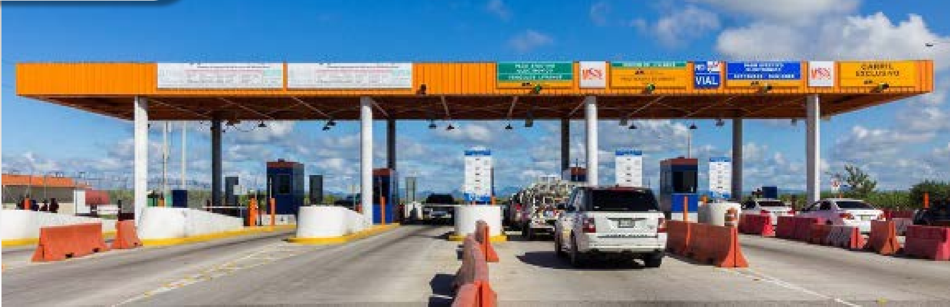
Estación Peaje Kilómetro-58 Autopista del Coral