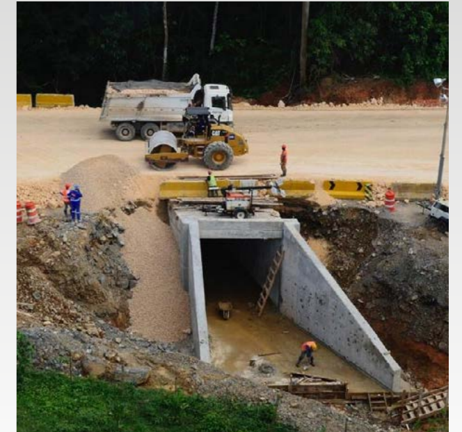
Alcantarilla Tipo Cajón