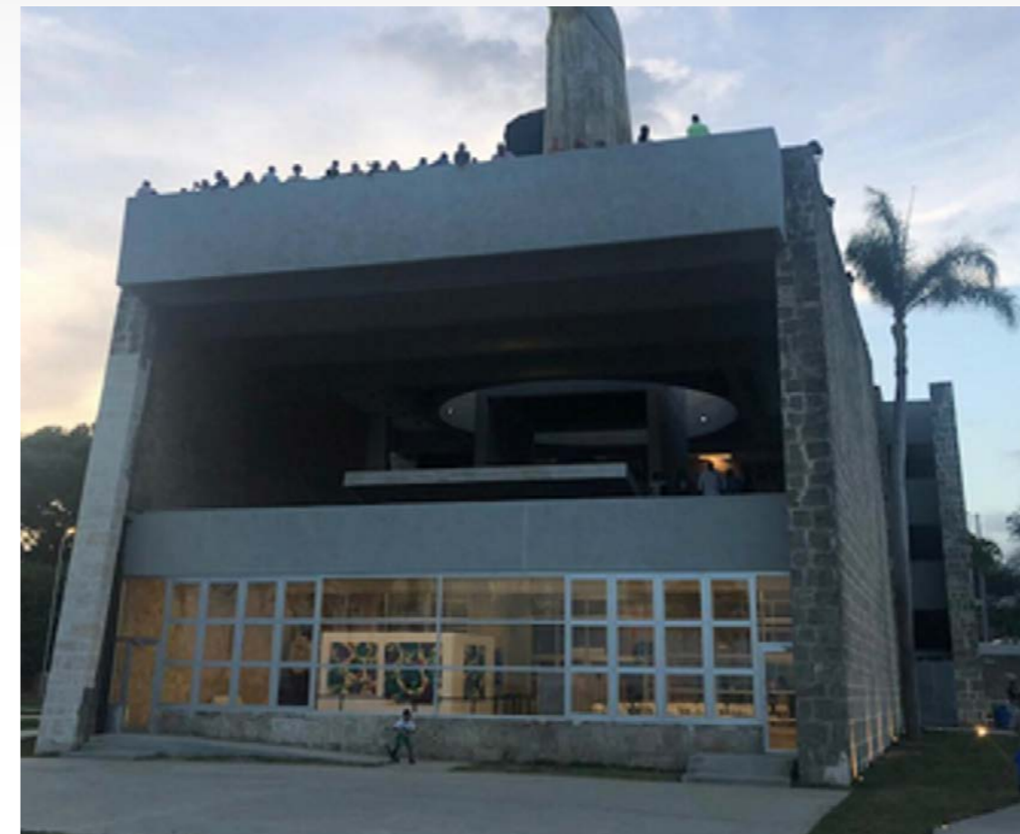
RECONSTRUCCION TRABAJOS EXTERIORES AL MONUMENTO FRAY ANTÓN DE MONTESINOS - Construcción parqueo en hormigón - Contrucción áreas verdes - Contrucción entrada principal al monumento